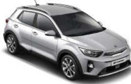
Silky Silver (4SS) Metál