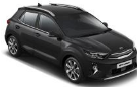
Aurora Black Pearl (ABP) Metál