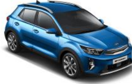
Sporty Blue (SPB) Metál