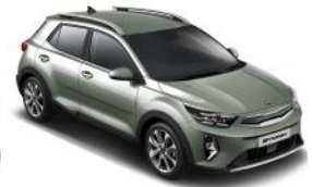
Urban Green (URG) Metál GT-Linehoz nem elérhető