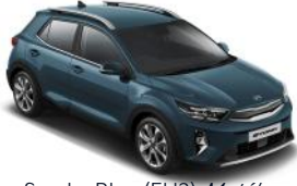
Smoke Blue (EU3) Metál GT-Linehoz nem elérhető