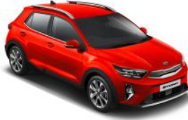
Signal Red (BEG) Metál