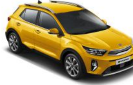
Most Yellow (MYW) Metál