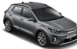
Perennial Grey (PRG) Metál