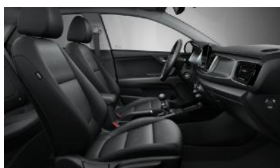
SILVER, SILVER VISION sztenderd fekete szövet