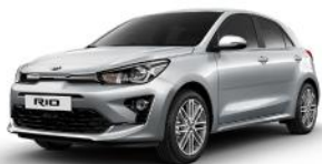
Silky Silver (4SS) METÁL