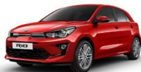
Signal Red (BEG) METÁL