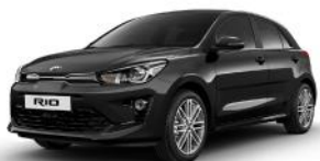
Aurora Black Pearl (ABP) METÁL