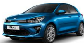
Sporty Blue (SPB) METÁL