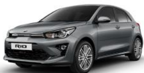
Perennial Grey (PRG) METÁL