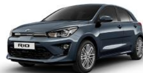
Smoke Blue (EU3) METÁL