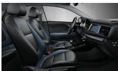
GOLD, PLATINUM opcionális műbőr/szövet KÉK-ANTRACIT (KCP)