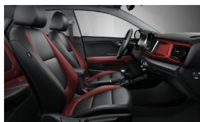
GOLD, PLATINUM opcionális műbőr/szövet PIROS-ANTRACIT (PCP)