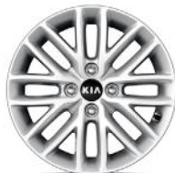
GOLD 15" könnyűfém keréktárcsa