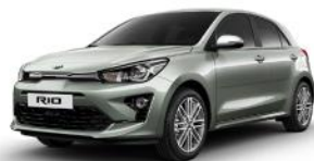
Urban Green (URG) METÁL