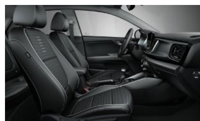
GT LINE sztenderd műbőr/szövet