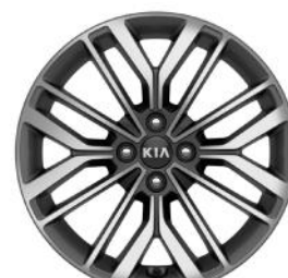
GT-LINE 17" könnyűfém keréktárcsa