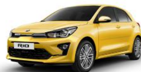
Most Yellow (MYW) METÁL