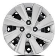
SILVER, SILVER VISION 15" acél keréktárcsa díztárcsával