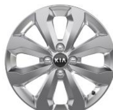
PLATINUM 16" könnyűfém keréktárcsa